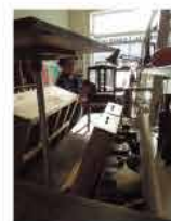
小椅子をお手入れ中