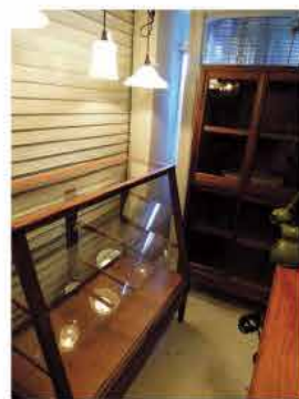
松葉屋へ連れて帰ります

SHOZO STYLEのお店「ROOMS」。雰囲気のある中古家具を扱います。今回は上のショーケースや小椅子を購入。