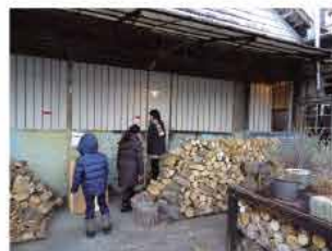
ちょっとドキドキ