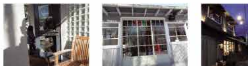
翌日の那須店はまっ白な銀世界