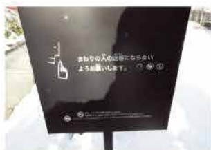
看板の裏側のPOPもさすが